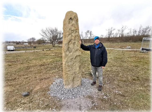
- Realizovaný menhir v Troskotovicích u Pálavy -

Na pozitivních místech a kříženích se stavěly kamenné menhiry nebo celé chrámy . Křemičité kameny – především žula a pískovec, obsahující křemen (SiO 2 ), mají schopnost přijímat a dále vyzařovat okolní energii. Jednoduše se jí nechávají krystaly oxidu křemičitého rozechvět a rezonují pak jako anténa společně v celé mase kamene onu energii do širokého okolí. Menhir je pozitivní rezonátor, který dokáže výrazně okolní pozemek harmonizovat a nabíjet vitální energií. Skalní blok (tvar vajíčka nebo stély – trámce) se z jedné třetiny zapouští do připraveného lože v zemi, a zbylé dvě třetiny zůstávají nad povrchem zářit do okolí. Přičemž ještě horní část menhiru přijímá také kosmické záření , zatím co spodní část menhiru je napojena na zemské záření . To se děje i přirozeně, „ samo sebou “, ale pokud se rozhodneme využít a posílit a nechat zářit pozitivní energie, zemskou vitální sílu na svém pozemku, pro svůj dům, byt, je ještě účinnější, usazený menhir aktivovat .