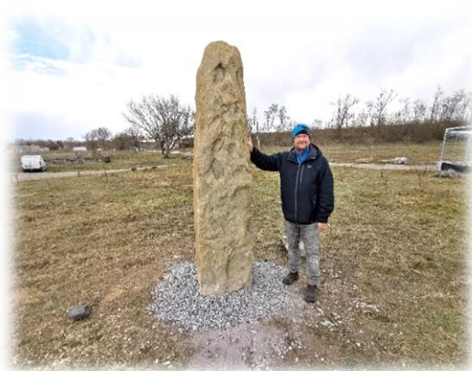
- Realizovaný menhir v Troskotovicích u Pálavy

Na pozitivních místech a kříženích se stavěly kamenné MENHIRY nebo celé chrámy . Křemičité kameny – především žula a pískovec, obsahující křemen (SiO 2 ), mají schopnost přijímat a dále vyzářovat okolní energii. Jednoduše se jí nechávají krystaly oxidu křemičitého rozechvět a rezonují pak jako anténa společně v celé mase kamene onu energii do širokého okolí. Menhir je pozitivní rezonátor, který dokáže výrazně okolní pozemek harmonizovat a nabíjet vitální energií . Skalní blok (tvar vajíčka nebo stély – trámce) se z jedné třetiny zapouští do připraveného lože v zemi, a zbylé dvě třetiny zůstávají nad povrchem zářit do okolí. Přičemž ještě horní část menhiru přijímá také kosmické záření , zatím co spodní část menhiru je napojena na zemské záření . To se děje i přirozeně, „ samo sebou “, ale pokud se rozhodneme využít a posílit a nechat zářit pozitivní energie, zemskou vitální sílu na svém pozemku, pro svůj dům, byt, je ještě účinnější, usazený menhir aktivovat . Aktivaci menhiru provádím po společné dohodě o jeho účelu – především jej napojím na Zdroj „nahoru“, na Zemi dolů, a zapojím do sítě nejbližších silových míst, silových akupunkturálních zemských pozitivních bodů a vortexů a podobných záříčů, menhirů, dolmenů. Aktivaci je vhodné načasovat např. až po probuzení ovocných stromů, až přestanou noční mrazíky. O tom všem se poradíme, vybereme živý „ aktilit “, i umístění.